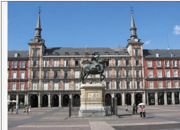
Plaza Mayor Madrid

– Hôtel de centre ville : le bruit des voitures en façade, celui