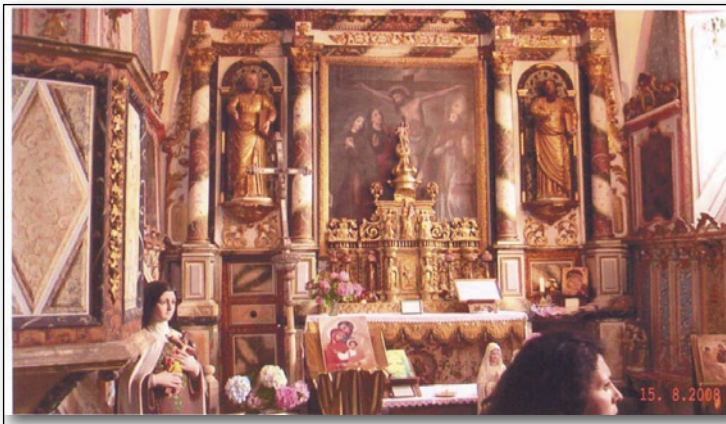
Eglise d'Orcun