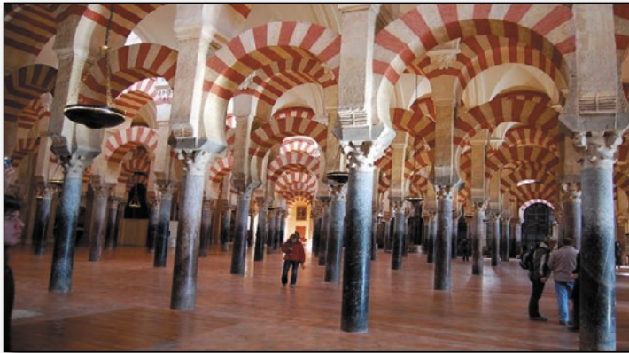
La Mosquée-Cathédrale de Cordoue

Magali est arrivée ; elle a son car et nous nous avons Magali et le car . Les plus inquiets sont rassurés : les uns pour le car, les autres pour Magali.