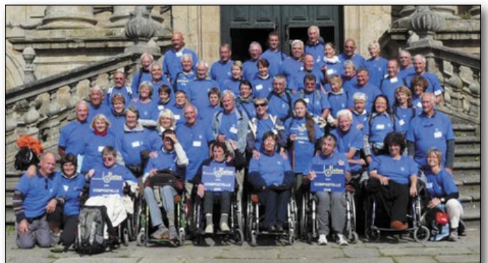
Le groupe sur le parvis de la cathédrale de St. J.de Compostelle