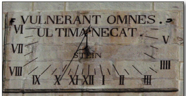
Toutes blessent, la dernière tue Eglise d'Urugne

Notre prochain objectif est le col de la Croix des Bouquets et peu après la halte casse-croûte..