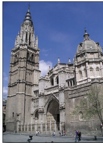
Cathédrale de Tolède