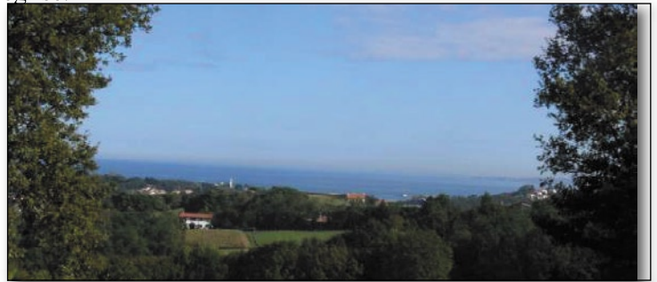
Au loin l'océan

Nous sommes redescendus sur Urugne et sa majestueuse église.