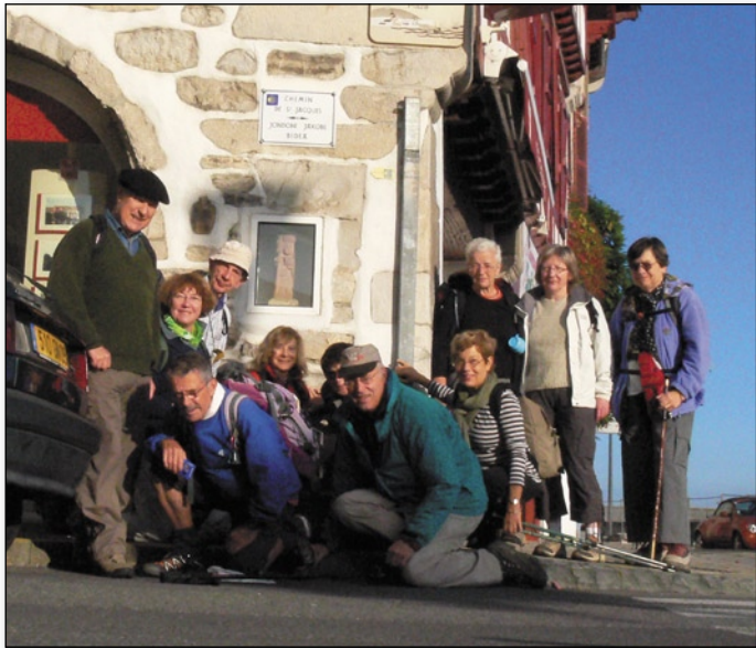
sous la statue

Dans Ciboure, au départ du Chemin nous avons le plaisir de découvrir, à l'angle de la rue, une statuette de St Jacques dans une niche. Cette statuette est accompagnée d'une jolie plaque en céramique signalant le Chemin par son logo et donnant son indication en basque et en français. Nous re-