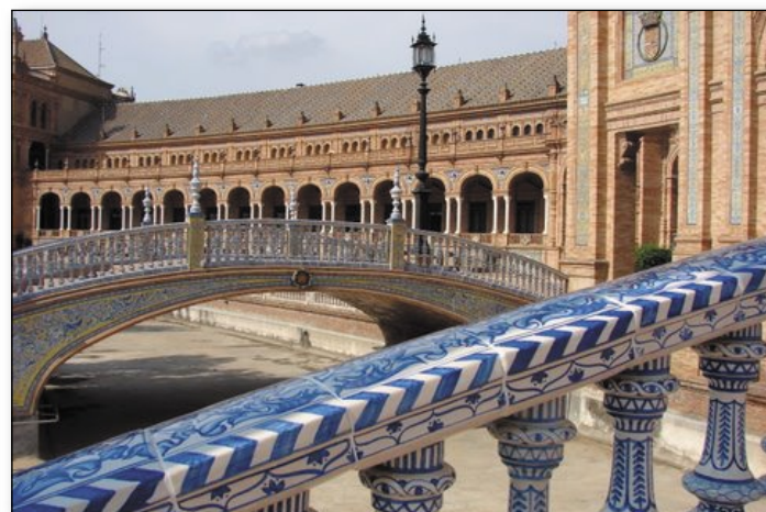
Place d' Espagne Séville

L'après-midi, on continue, avec la place d'Espagne, étonnant ensemble construit pour l'expo de 1929 et tour de ville, en bord du Guadalquivir. Au-delà du fleuve, Triana le quartier des Gitans et la Maestranza, les arènes mythiques de la ville.