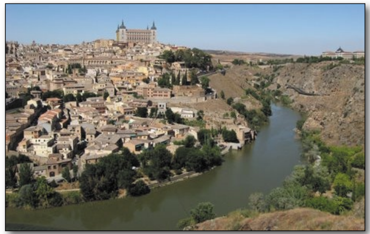
Le Tage et Tolède

J'aime beaucoup ces temps libres où l'on choisit ses com-