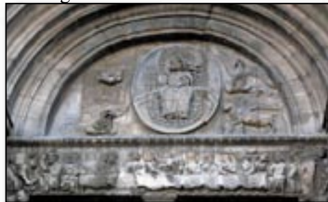
Portail de l'ancienne abbatale Saint-Gilles

les débats. Une messe solennelle en la primatiale Saint-Trophime d'Arles clôturait cette manifestation très intéressante et émouvante. Merci vivement aux organisateurs !