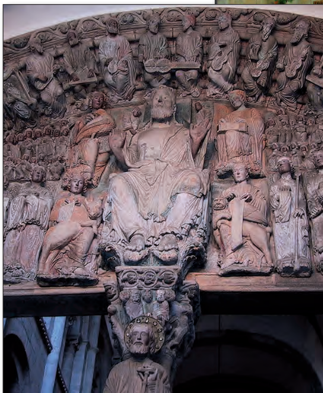
Portique de la gloire : Santiago