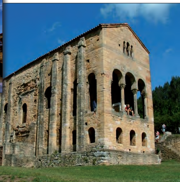
Église Santa María del Naranco d'Oviedo

- Retour sur BAYONNE avec de petits arrêts sur la côte... SAN VICENTE DE LA BARQUERA... SANTILLANA - et plus si le temps nous le permet... Toujours un problème d'horaires à respecter... Retour prévu vers 19h à LAUGA-BAYONNE